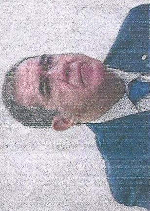
O deputado federal Luiz Gastão (PSD)