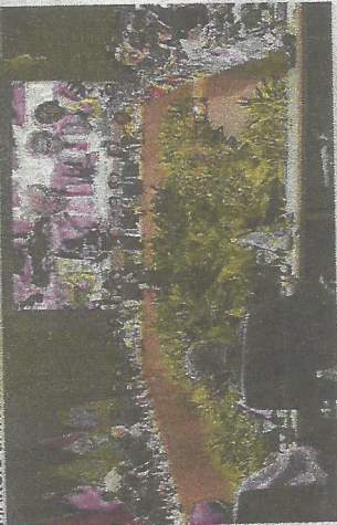
CHEFES da diplomacia do G20 reunidos