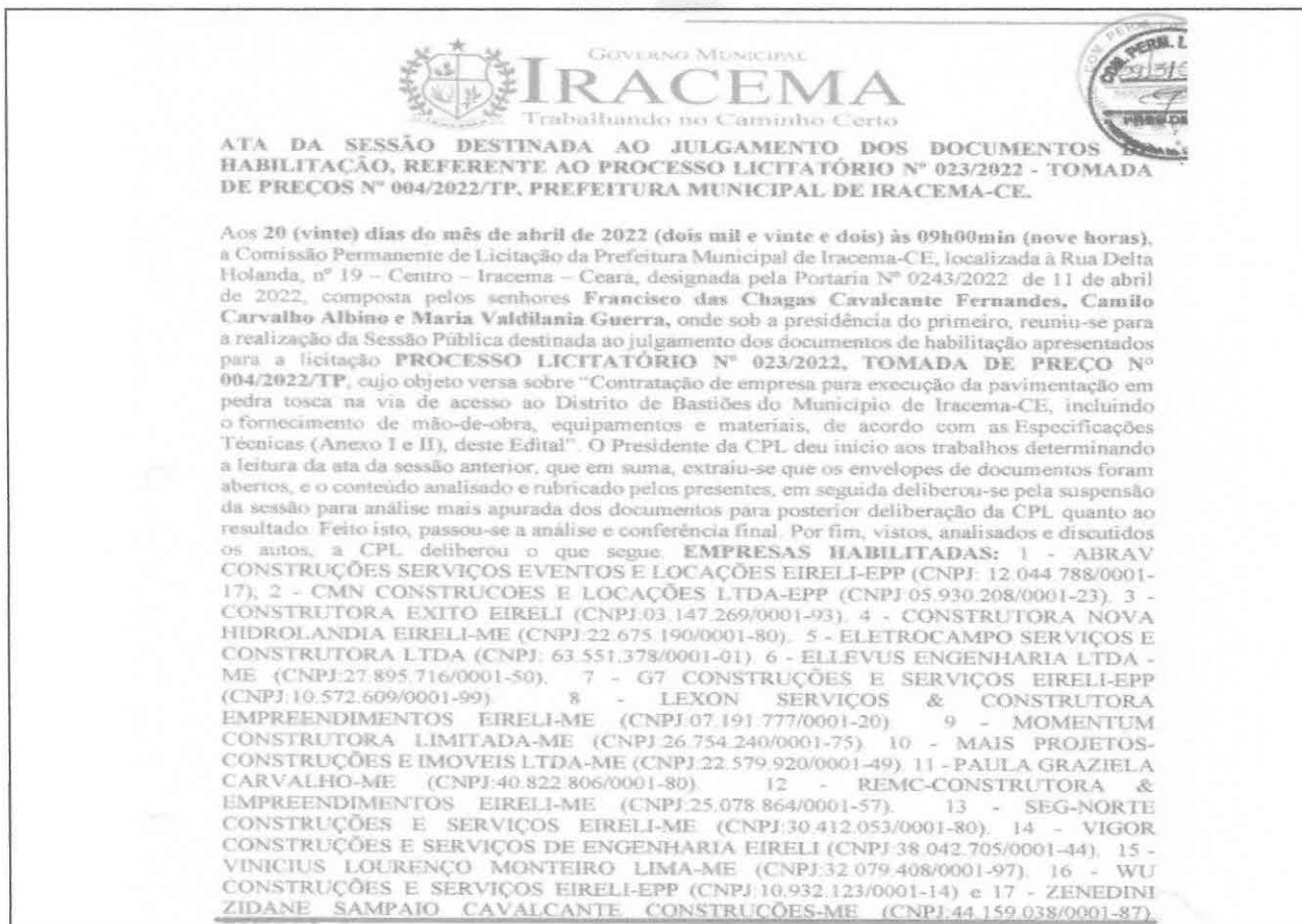
Imagem 03 – Trecho da ata de habilitação do certame TP 004/2022-TP

Outrossim, se faz necessário expor que no certame pertinente ao processo licitatório n.º 023/2022 – TOMADA DE PREÇOS N.º 001/2022/TP, de responsabilidade desta mesma CPL, cujo objeto era Contratação de empresa para execução da pavimentação em pedra tosca na via de acesso ao Distrito de Bastiões do Município de Iracema-CE, incluindo o fornecimento de mão-de-obra, equipamentos e materiais, de acordo com as Especificações Técnicas (Anexo I e II), deste Edital, a empresa RECORRENTE se utilizou da mesma CAT profissional e foi julgada corretamente HABILITADA. Como a CPL pode parafrasear tais condutas com tamanha disparidade? Vejamos na íntegra a ATA DE HABILITAÇÃO lavrada na ocasião: