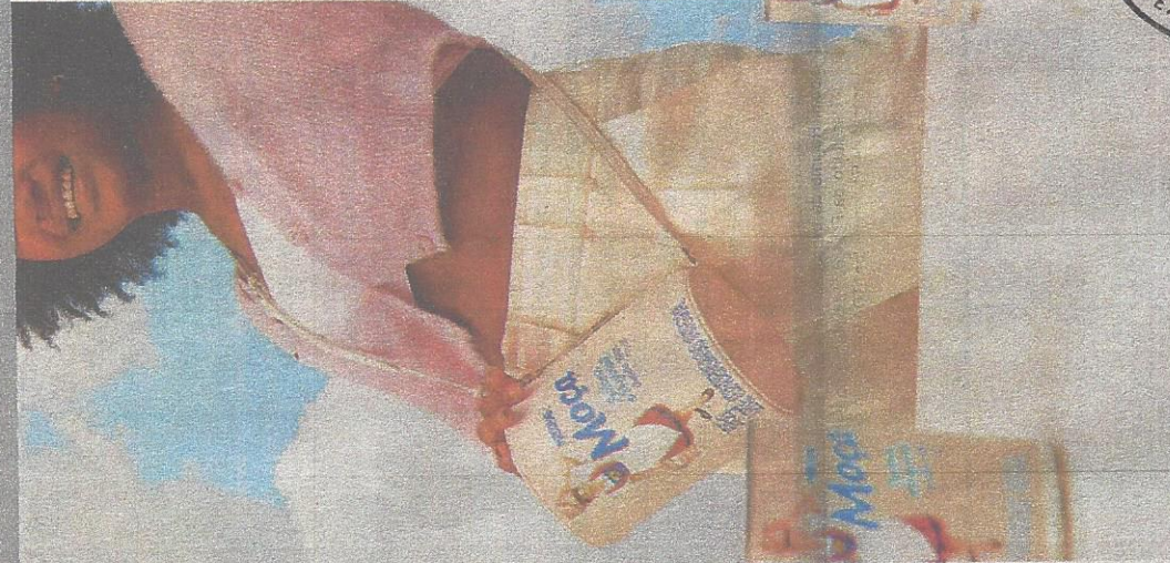
CAMPANHA para comemorar os 100 anos do Leite Moça no Brasil em conjunto com a Anacapri