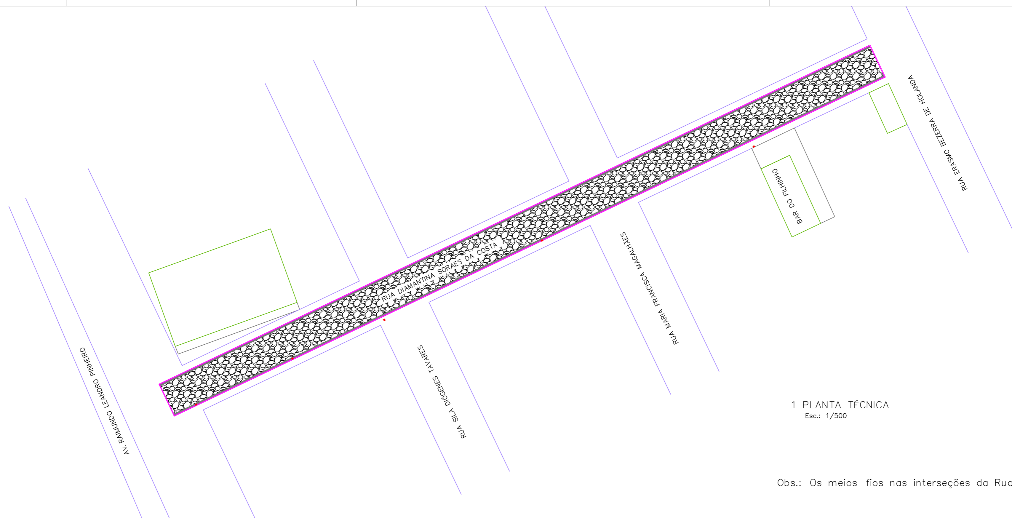
1 PLANTA TÉCNICA Esc.: 1/500

Obs.: Os meios-fios nas interseções da Ruas serão rebaixados