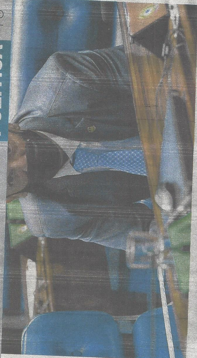
SENADOR Márcio Bittar defende retirada dos pisos de saúde e educação

Após divergências sobre trechos da Proposta de Emenda à Constituição (PEC) 186/2019, o Senado Federal deve votar, na próxima quarta-feira, 3, o projeto conhecido como PEC emergencial, que prevê o acionamento de medidas em caso de crise nas contas públicas. A tramitação da mensagem está diretamente ligada à continuidade de do auxílio emergencial no País e à celeridade com a qual o benefício chegará na ponta.