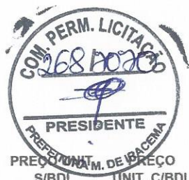
TABELA SEINFRA-CE 026.1 BDI APLICADO: 26,85%

PROP.: PREFEITURA MUNICIPAL DE IRACEMA OBRA : PAVIMENTAÇÃO EM PEDRA TOSCA SEM REJUNTAMENTO DAS RUAS RONALDO BANDEIRA E SÃO JOSÉ LOCAL: BAIRRO SÃO JOSÉ DO MUNICÍPIO DE IRACEMA-CE - IRACEMA-CE