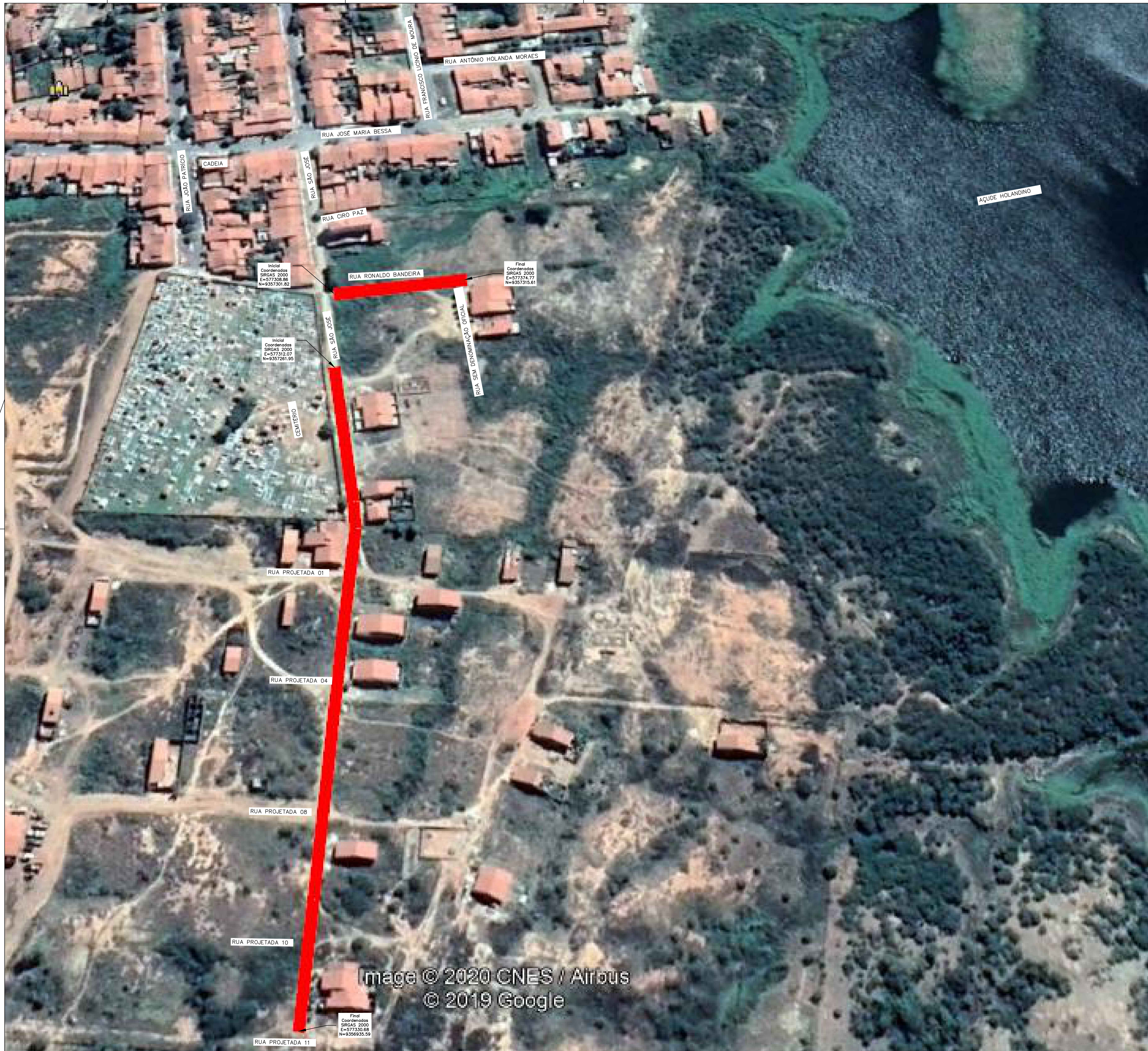
Imagem © 2020 CNES / Airbus © 2019 Google