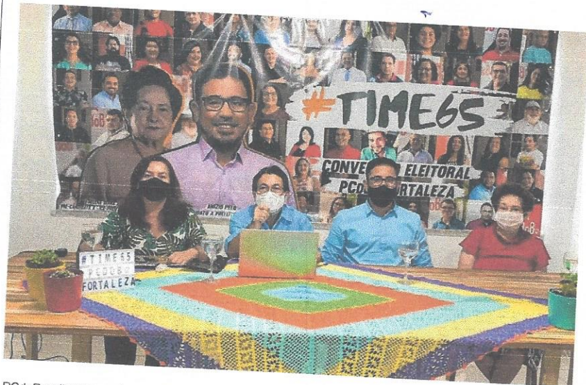
PCdoB realizou transmissão virtual da convenção, mas sofreu com problemas técnicos