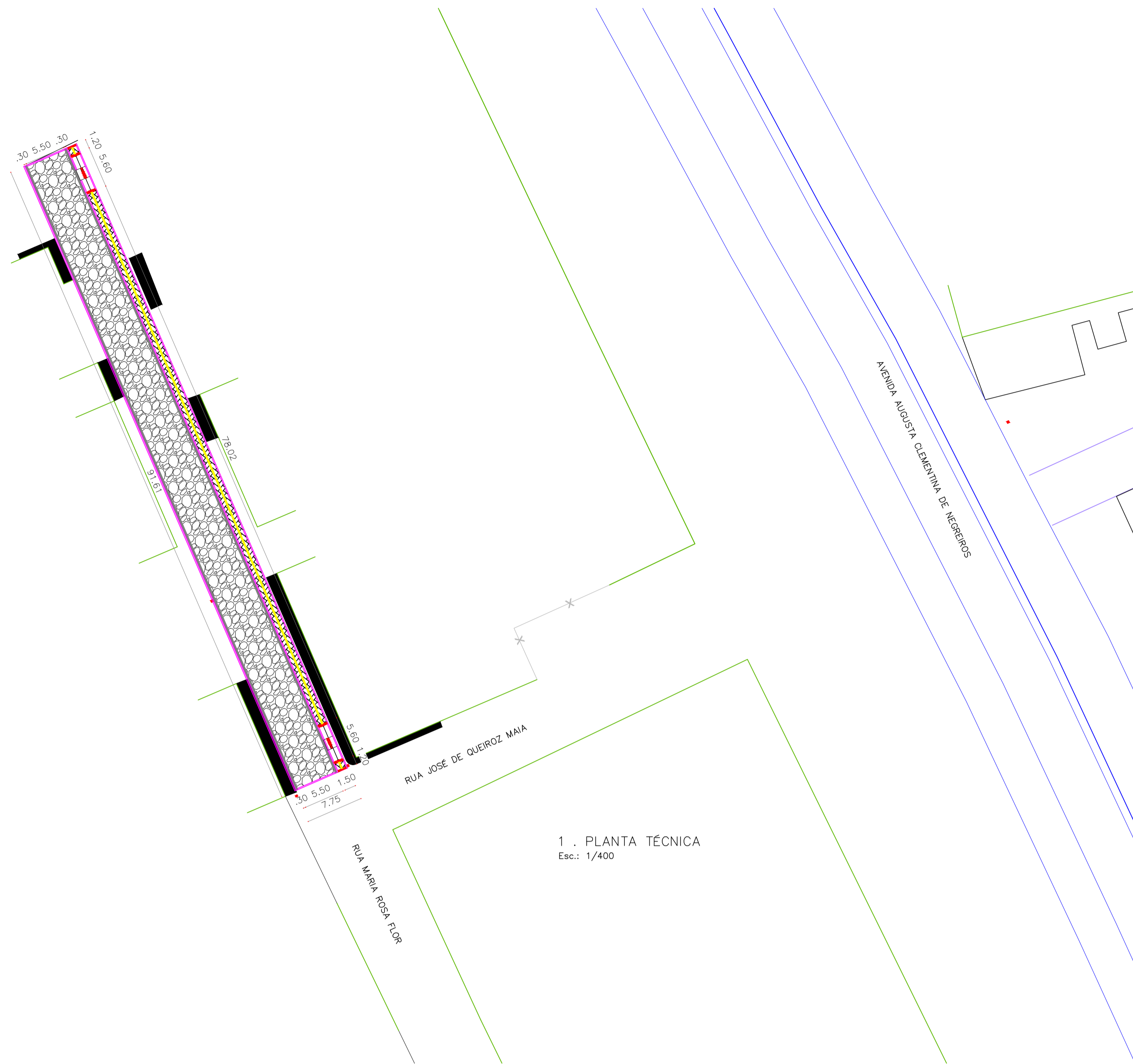
1 . PLANTA TÉCNICA Esc.: 1/400