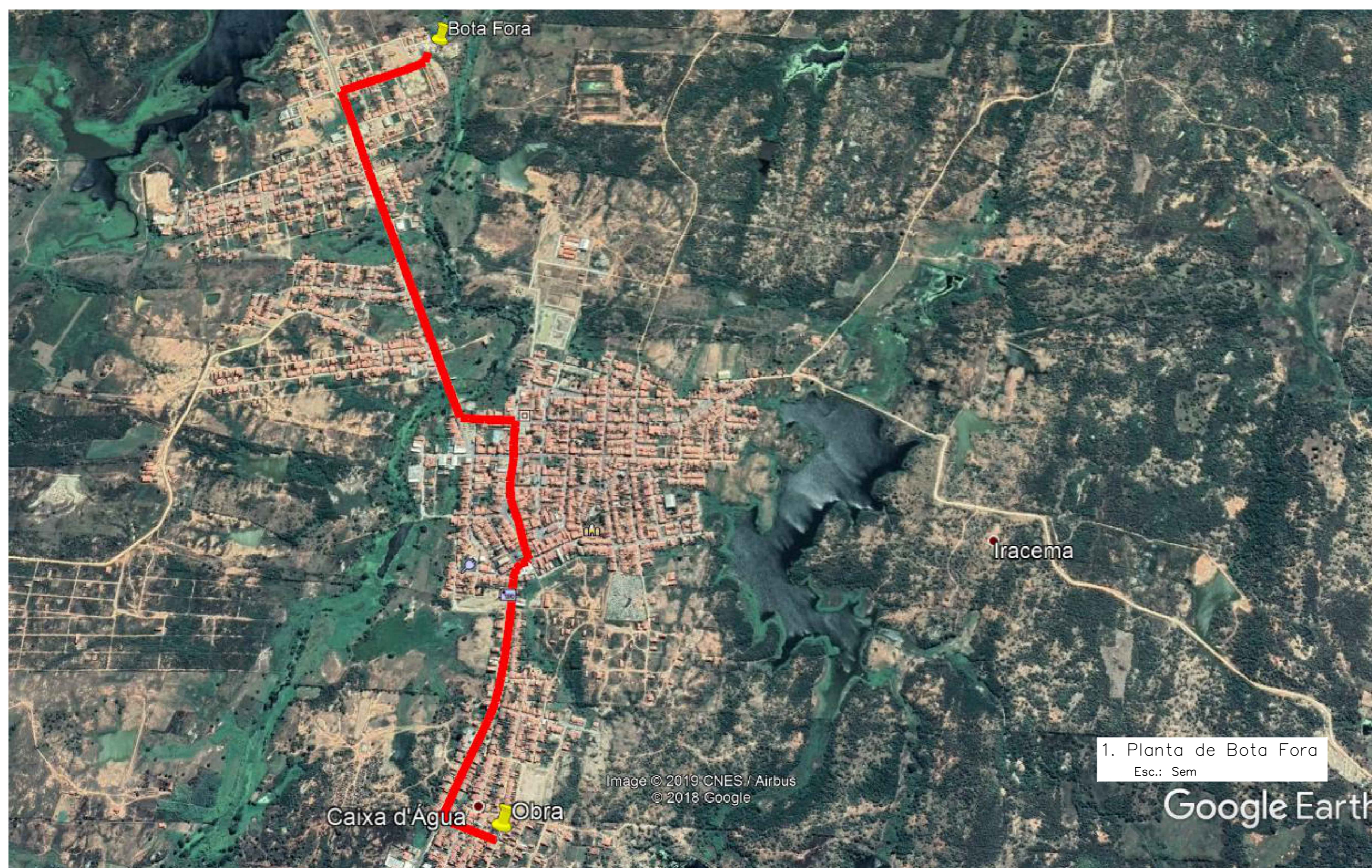
1. Planta de Bota Fora Esc.: Sem