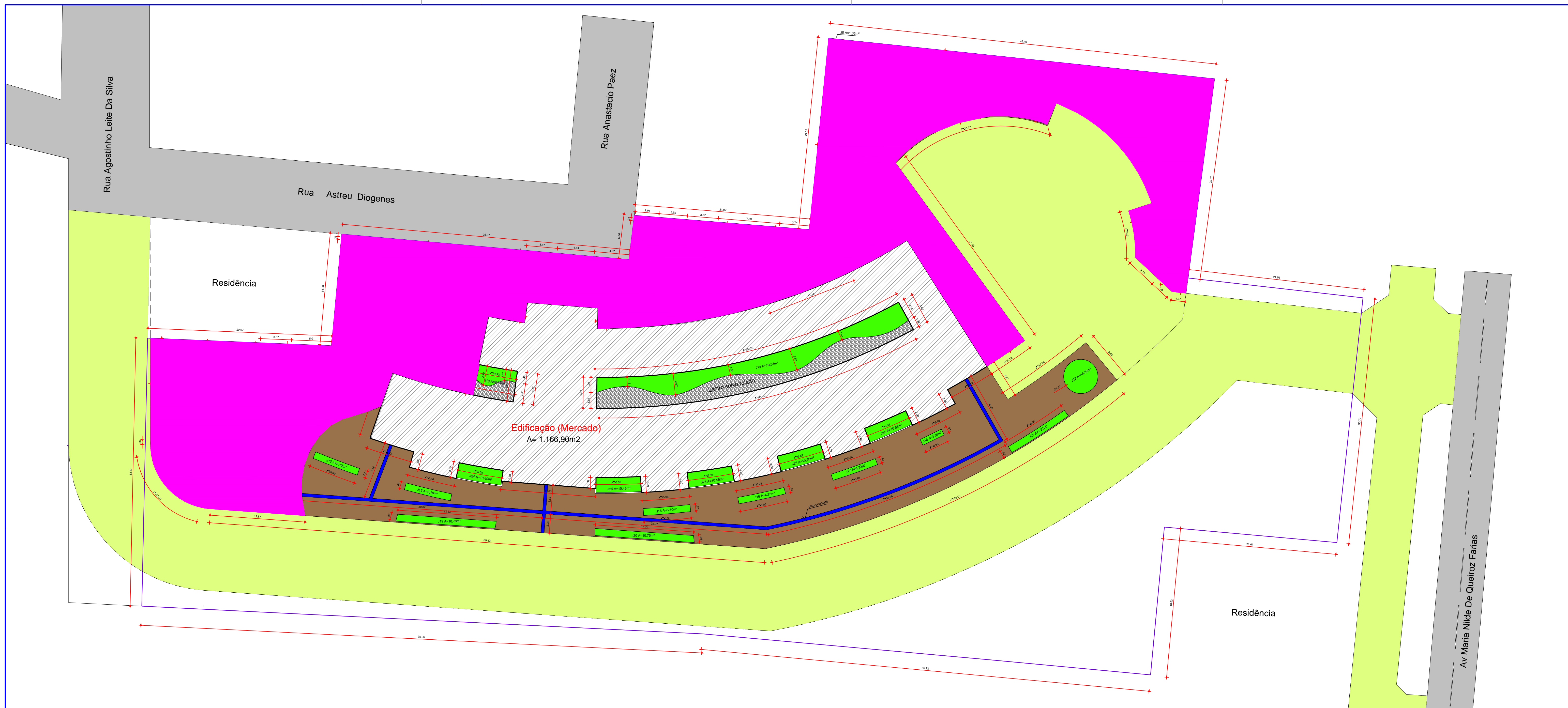
1 Planta de Áreas ESCALA 1:250