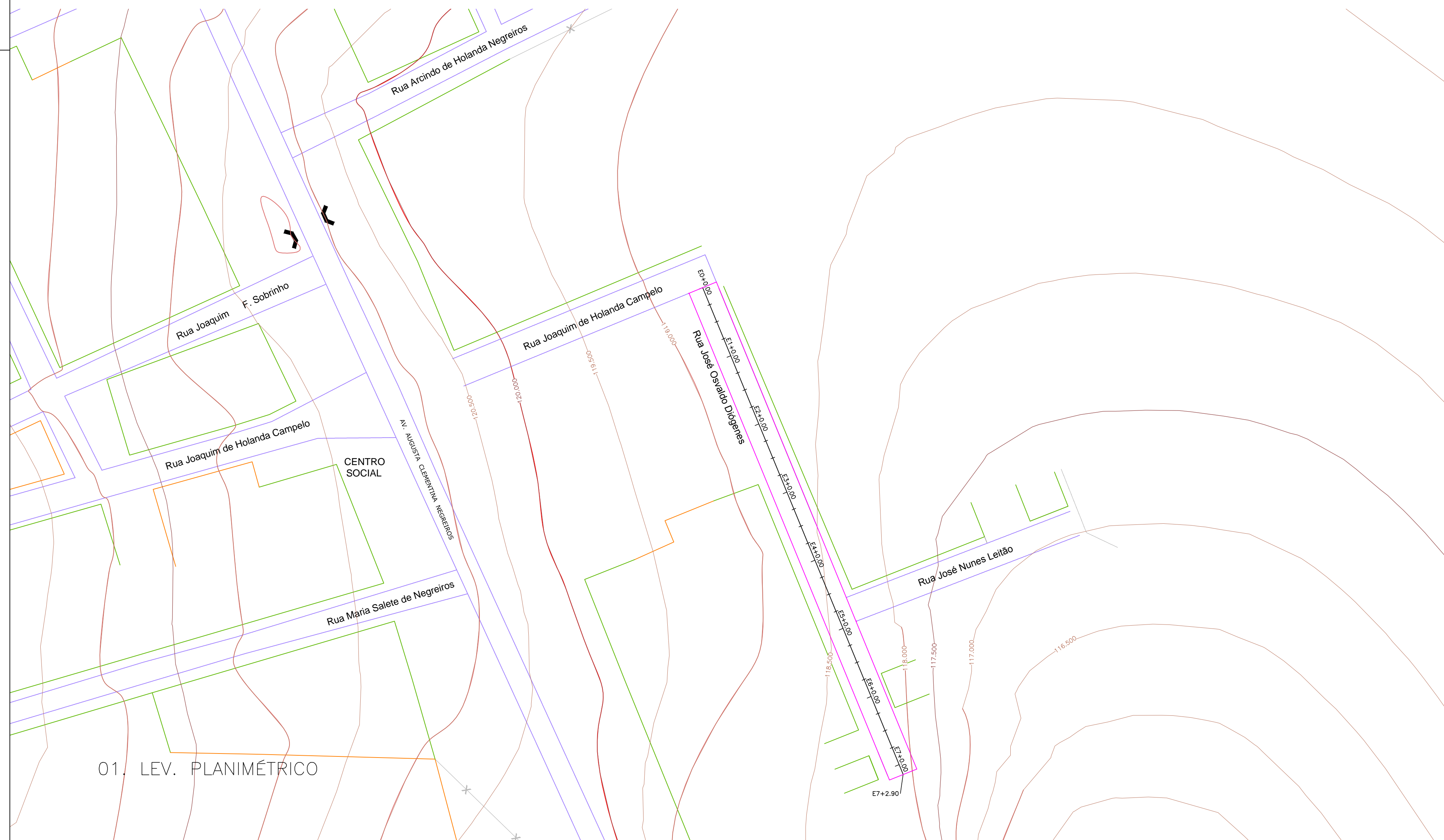
01. LEV. PLANIMÉTRICO