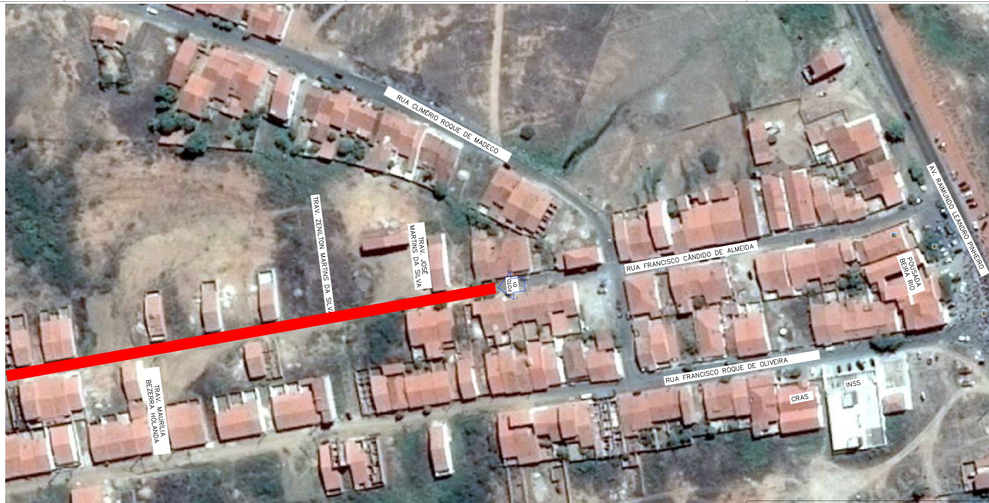
1 . IMAGEM DE SATÉLITE (Google) Esc.: Sem Escala