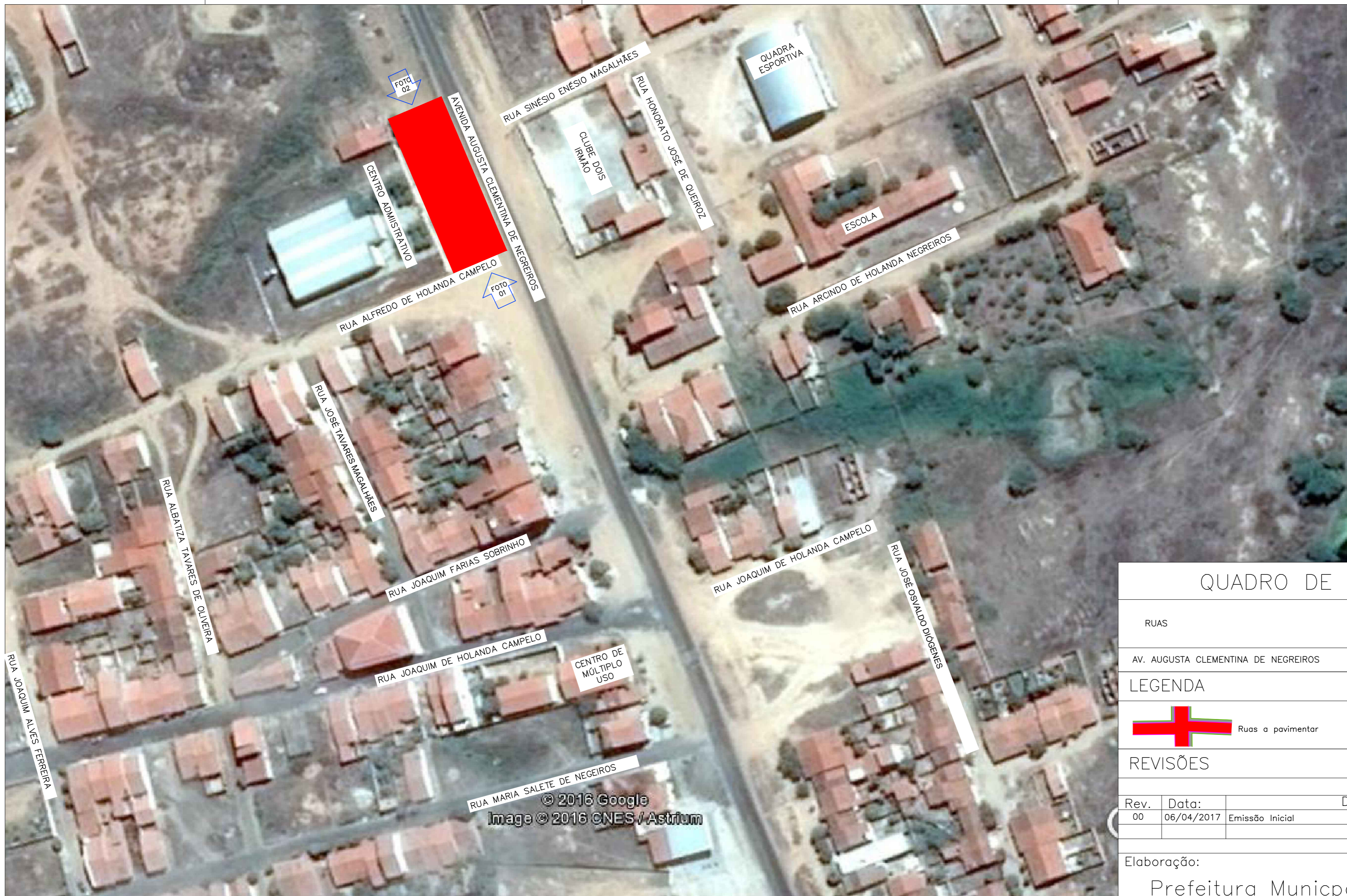
1 . IMAGEM DE SATÉLITE Esc.: Sem Escala