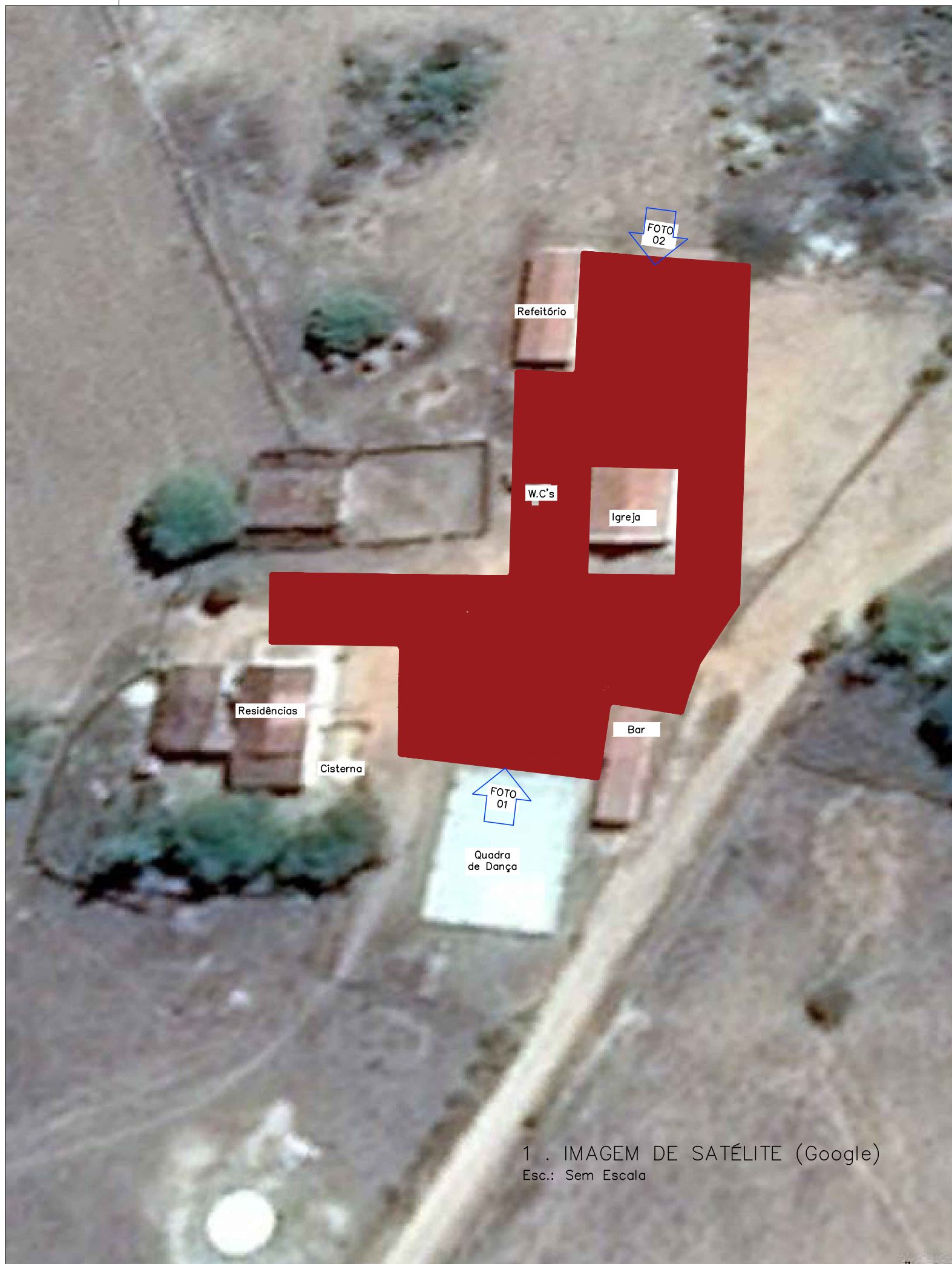
1 . IMAGEM DE SATÉLITE Esc.: Sem Escala